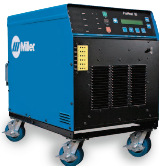
Источник питания системы ProHeat 35 на тележке (опция, 195436)

Индукционные одеяла с легкостью и за несколько секунд устанавливаются как на цилиндрические, так и на листовые детали. Произведенные из долговечного, устойчивого к высоким температурам материала, гибкие индукционные одеяла предназначены для работы в тяжелых условиях промышленных производств и строительства.