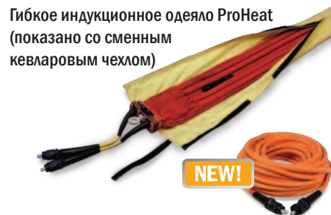
Гибкое индукционное одеяло ProHeat (показано со сменным кевларовым чехлом)

Кабели с воздушным охлаждением обеспечивают ту же гибкость, что и кабели для предварительного нагрева с жидкостным охлаждением