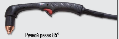
Ручной резак 85°

Стандартные резаки Duramax Hyamp (дополнительные варианты резаков см. на веб-сайте www.hypertherm.com )