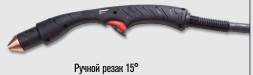
Ручной резак 15°