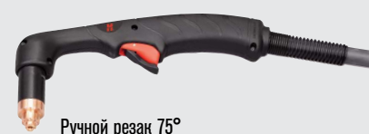
Ручной резак 75°

(дополнительные варианты резаков см. на веб-сайте www.hypertherm.com )