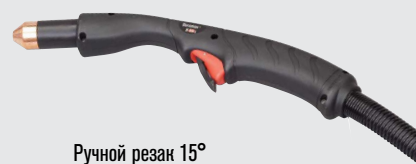
Ручной резак 15°