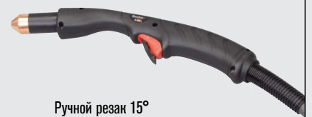
Ручной резак 15°