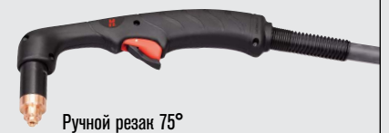
Ручной резак 75°

(дополнительные варианты резаков см. на веб-сайте www.hypertherm.com )