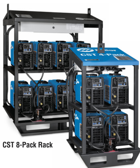
CST 8-Pack Rack