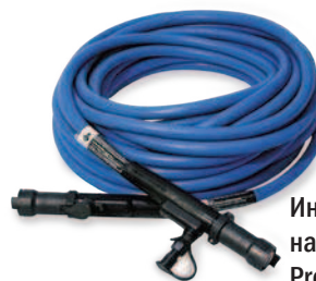
Индукционный нагревательный кабель ProHeat с жидкостным охлаждением

Улучшенные условия труда для сварщиков во время работы. Сварщики не подвергаются воздействию открытого огня, взрывоопасного газа и высокой температуры, как это бывает при газовом или резистивном электронагреве.