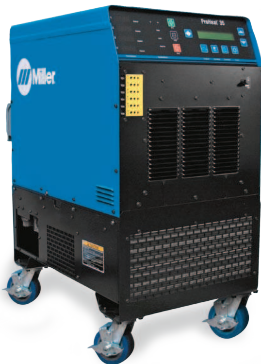
Источник питания системы ProHeat 35 с высокопроизводительным устройством охлаждения (301298) и на тележке (опция, 195436)

Созданные для гибкости и эффективности в работе, удлинительные кабели с жидкостным охлаждением могут быть уложены в конфигурации различных форм и диаметров, обеспечивая решение практически любой задачи по индукционному нагреву. Также они отлично подойдут к тем задачам предварительного нагрева, в которых температурный режим и геометрия изделий не позволяет использовать индукционные одеяла с воздушным охлаждением.